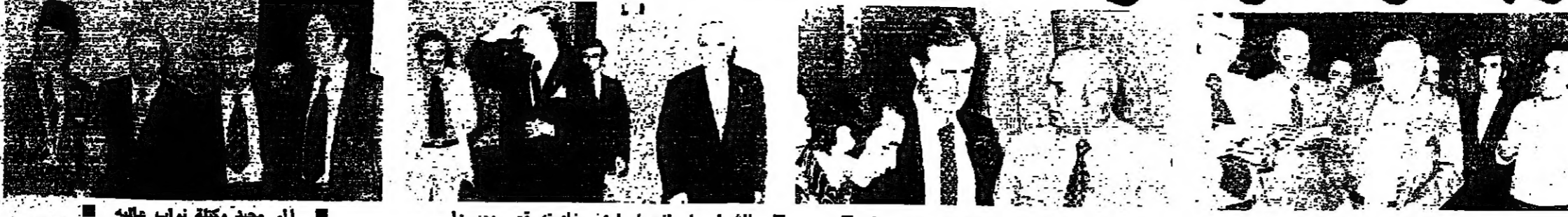
الرئيس حمادة لدى مغادرته قصر بعبدا ■ السيد كمال جليلانى يلقى بعبدا ■ الشيخ بيار الجليل لدى مغادرته قصر بعبدا